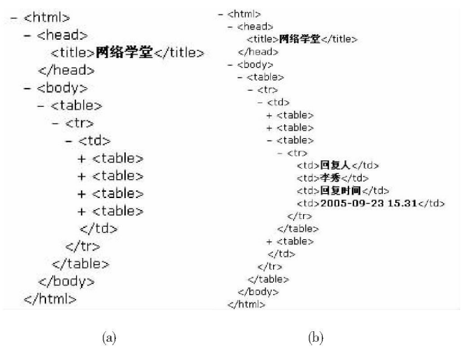
图 1 主题列表 DOM 树结构图 Fig.1 DOM tree structure diagram of topic list

从技术角度, 论坛页面有动态和静态两种. 不管是动态还是静态, 论坛的页面一般都由模板生成. 论坛页面结构的相似性不仅包括页面与页面的相似性, 还包括同一页面内信息块结构的相似性. 对于前一种相似性, 在基于模板的信息抽取中已有不少研究. 对于后一种相似性, 是本方法着重分析利用的对象. 如在论坛主题列表页面中, 每增加一个主题帖, 页面结构会增加一个重复结构模块, 我们把这种重复结构模块称为重复模式. 只要能发现论坛页面的重复模式, 通过用户在重复模式中选择需要抽取的属性, 抽取规则便可以自动生成, 如图 1 所示. 图 1(a)是一个简化了的帖子列表页面的 DOM 树, 除第一个 table 节点外, 其它每个 table 节点均为一个主题帖, 图 1(b)是将其中的一个 table 节点展开后的 DOM 结构. 通过对大量论坛结构分析表明, 每个主题贴 (或回帖、跟贴) 有以下的特征: (1) 每个主题贴 (或回帖、跟贴) 都是一个相对独立的 DOM 子树. (2) 这些 DOM 子树在同一父节点下, 并互为兄弟节点. (3) 这些 DOM 子树具有相同的内部结构, 变化的只是信息的内容.